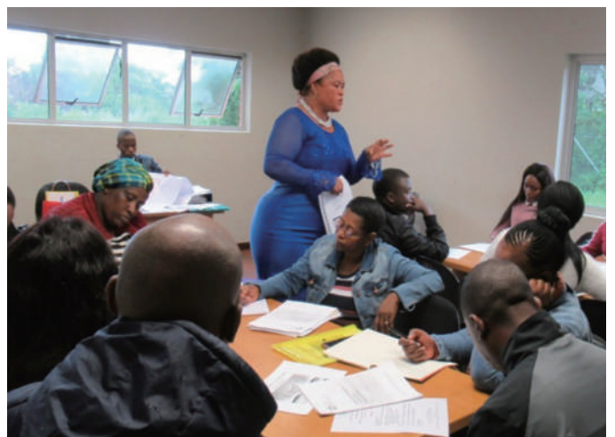
司書研修会で講師を務めるクマロ先生

私たちが受け取った上記の寄贈の写真を証拠として添付しますのでご覧下さい。今後も連絡を頂けると嬉しいです。