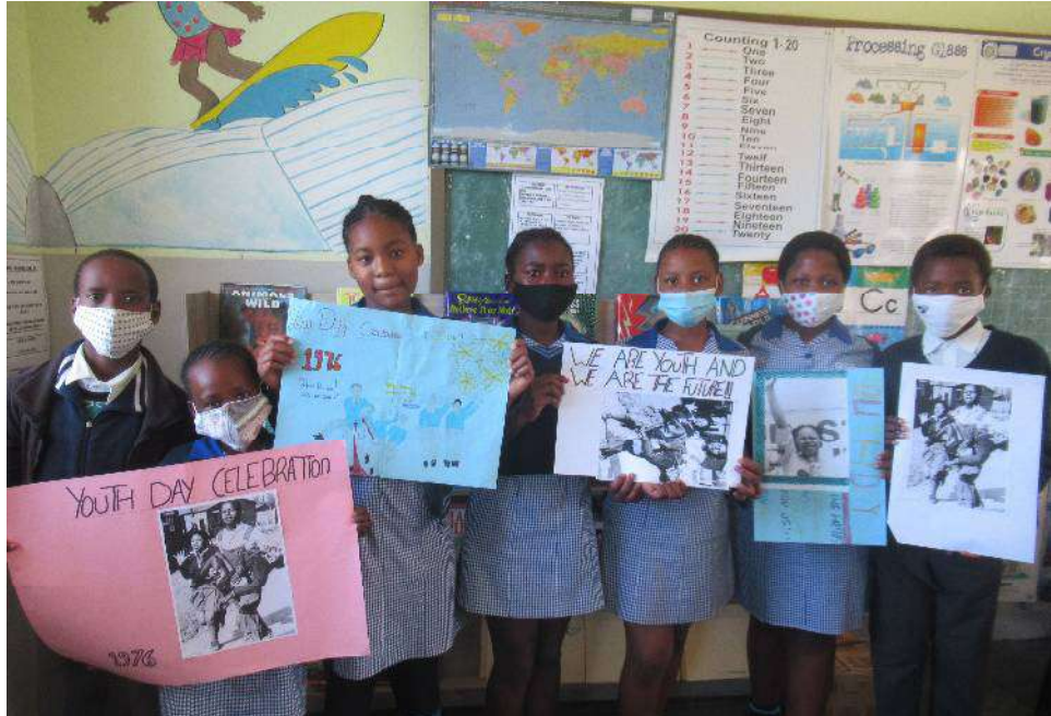
図書室で YOUTH DAY について調べ発表するビューラ小学校の生徒たち